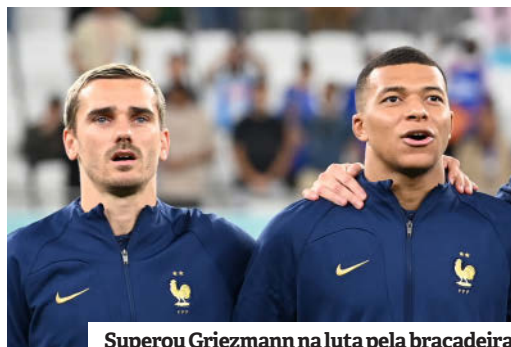
Superou Griezmann na luta pela braçadeira

“O Kylian reúne todas os requisitos para esta responsabilidade. No campo e na vida do grupo, é um elemento unificador”, explicou o selecionador, numa decisão que desagradou ao craque