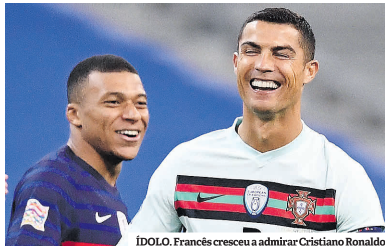
ÍDOLO. Francês cresceu a admirar Cristiano Ronaldo

Separados por dois anos de idade, estes jovens craques prometem animar a luta pelo trono do futebol no futuro próximo e, quem sabe, deixar para trás alguns dos registos históricos atingidos por Ronaldo e Messi. E se o sucesso pessoal é muitas vezes o que mais salta à vista, na hora de distribuir Bolas de Ouro é sempre preciso ter em conta o sucesso dos respetivos coletivos. E, aí, o peso da Champions é muito grande. Uma prova que continua atravessada na garganta de Mbappé e que Haaland ainda pode vencer na atual temporada. No que a golos na Liga dos Campeões diz respeito, o francês soma 40, enquanto o norueguês já vai nos 34. Ambos ainda longe