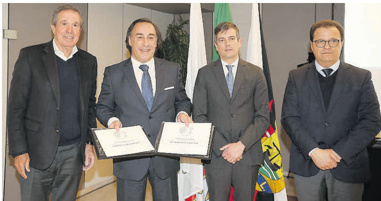
DISTINÇÃO. A 27 de fevereiro deste ano, o presidente do Leões Porto Salvo (segundo à esquerda) recebeu os dois certificados de Entidade Formadora 5 estrelas, referentes ao futsal masculino e futsal feminino