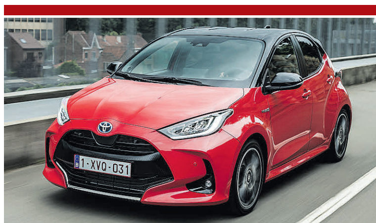
TOYOTA YARIS. O irmão mais ‘velho’ do Mazda 2 é, como pode constatar-se, idêntico. Mas depois da cedência aos compatriotas, a Toyota puxou pelo Yaris e lançou a versão GR Sport (desportiva) e apostou numa declinação muito interessante – o Yaris Cross, com inspiração ‘crossover’

O maior obstáculo, se assim podemos chamar, acaba por ser o preço, que fica próximo de modelo com motor de combustão do segmento acima. Mas a tecnologia híbrida explica os valores. Compensados depois pela eficácia do Mazda 2 em termos de consumo e desembaraço no ambiente urbano. ●