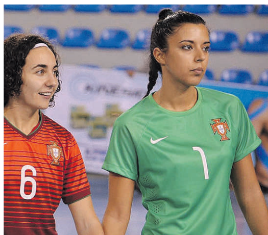
2014. Começou pela Seleção Universitária até chegar à Seleção A de Portugal. Um sonho realizado e com várias epopeias, como o Mundial 2014, na Costa Rica

-redes, confessando viver assustada com os vários casos de assédio denunciados ultimamente. “O assédio existe, dá-me ansiedade e preocupa-me porque sendo uma mulher do desporto, as minhas filhas também o serão, seja em que desporto for. Ouvi determinadas coisas que não devia ter ouvido quando ainda nem se falava da problemática e era um assunto tabu. É uma questão muito delicada, mas o facto de haver abertura para falar já é um ponto crucial. Havendo conhecimento, é dar voz a quem passa pelas situações para se julgar que prevenciou”, atirou.