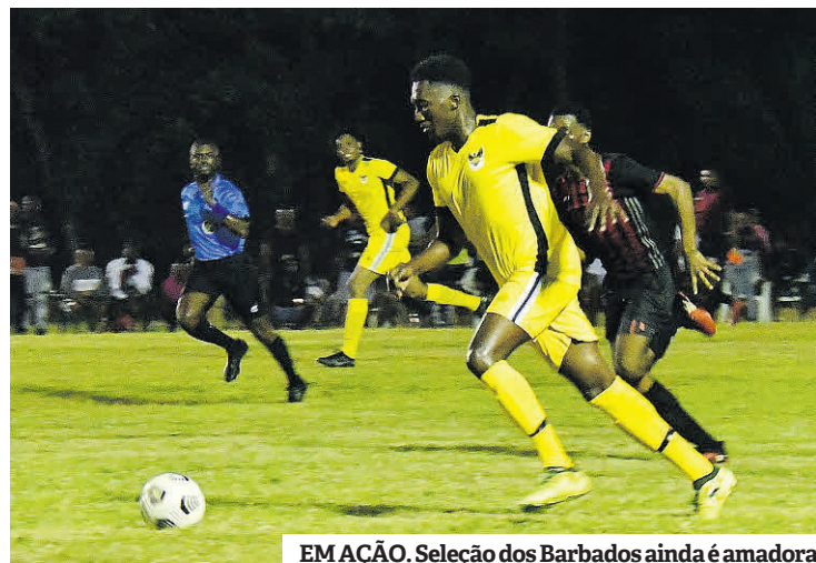
EMAÇÃO. Seleção dos Barbados ainda é amadora

A nova edição da Liga das Nações arranca em setembro, ainda sem adversários definidos. “Claro que gostaria de ficar em 1º e subir à Liga A. Não sendo possível, o objetivo passará por evitar a descida à Liga C, onde competem as seleções mais fracas”, diz-nos lembrando: “No fim, o treinador é sempre avaliado pelos resultados.”