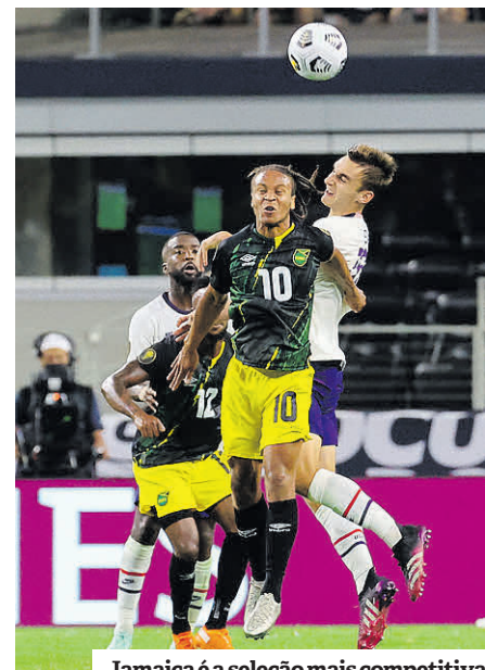
Jamaica é a seleção mais competitiva

‘pescado’ Bobby Reid (Fulham), Michail Antonio (West Ham) ou Ethan Pinnock (Brentford) na Premier League. Mas nada bate Curaçau, que na última década subiu 100 lugares no ranking FIFA muito graças aos jogadores nascidos na Holanda: eram 19 na última convocatória.