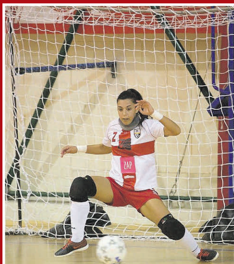
2016. Em Milão, ao serviço do Kick Off, a guarda-redes travou inúmeras iniciativas dos adversários ao longo de três temporadas