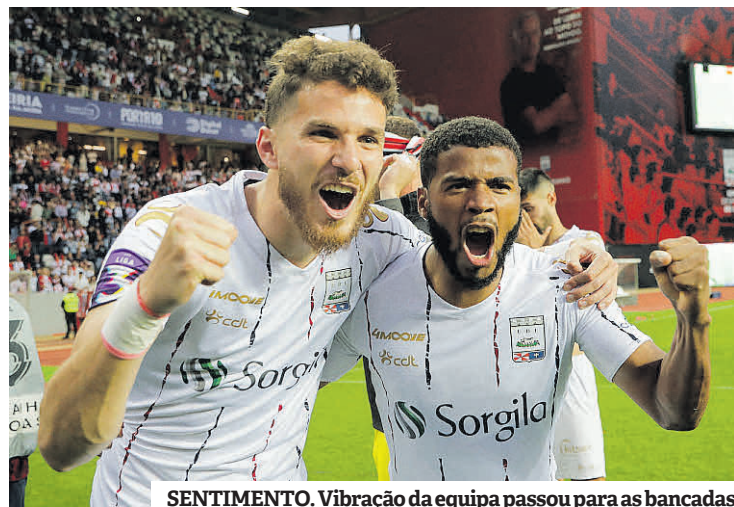
SENTIMENTO. Vibração da equipa passou para as bancadas