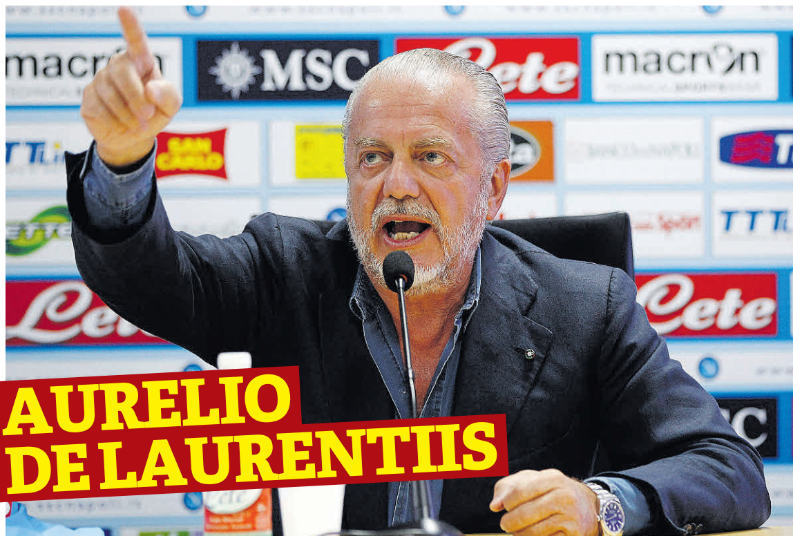
AURELIO DE LAURENTIIS

Nascido em Roma, há 73 anos, De Laurentiis seguiu desde cedo o negócio da família e, tal como o seu pai e o seu tio, tornou-se produtor cinematográfico – não deixa de ser irónico que este 'one man show' esteja ligado ao cinema. A paixão pelo Nápoles foi-lhe transmitida pelo pai e, em 2004, altura em que o clube declarou bancarrota e disputava a Serie C, De Laurentiis adquiriu-o por um valor a rondar os 20 milhões de euros. O sucesso foi imediato: em 2006 os napolitanos subiram à Serie B, dois anos depois regressaram à Serie A e em 2010 estavam já a disputar as competições europeias. Apesar do sucesso dentro de campo, a verdade é que os 19 anos que De Laurentiis leva à frente dos destinos dos napolitanos foram tudo menos pacíficos. O presidente é conhecido pelas suas declarações controversas e, desde logo, isso