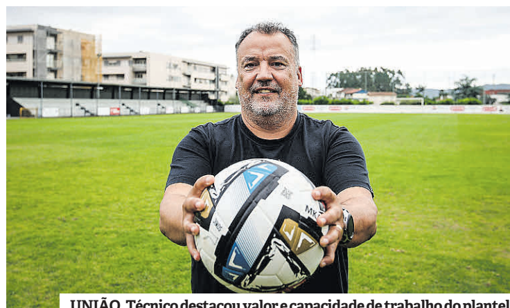
UNIÃO. Técnico destacou valor e capacidade de trabalho do plantel

cha, atualmente com 50 anos, destacou ainda a festa no dia da subida: “Foi ótimo ver a alegria das pessoas e o estádio cheio. O Ribeirão já esteve num patamar competitivo superior, mas agora voltámos a sentir as pessoas unidas à volta do clube. Houve foguetes, passeámos pela vila de autocarro, as pessoas vieram à porta para nos ver e para nos aplaudir.”